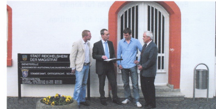
Bürgermeister für Reichelsheim: Bertin Bischofsberger